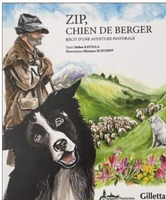
Zip, un chien d'exception qui protège les troupeaux de brebis et qui... parle !

Dans le livre, c'est le chien qui parle. Un border collie